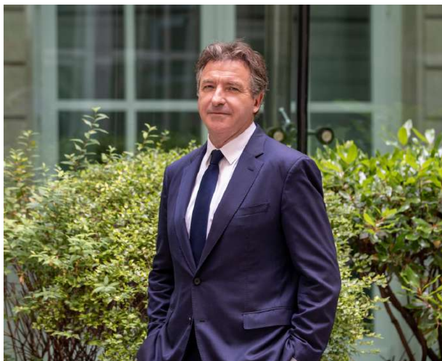
Président de la FNTP : Bruno CAVAGNE

Ce "génie écologique" qui regroupe un ensemble d'expertises propres aux travaux publics, va devenir une composante essentielle de l'activité de nos entreprises. Pour les accompagner, nous allons leur proposer un ambitieux plan de formation à la transition écologique dès janvier 2023.