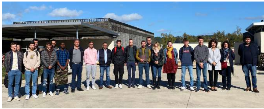
2e promotion Licence Professionnel "Encadrement chantier TP" du Lycée Martin Nadaud

L'occasion pour les étudiants d'assister à une présentation des membres de l'équipe pédagogique, du programme de leur formation et du déroulé de leur année scolaire.