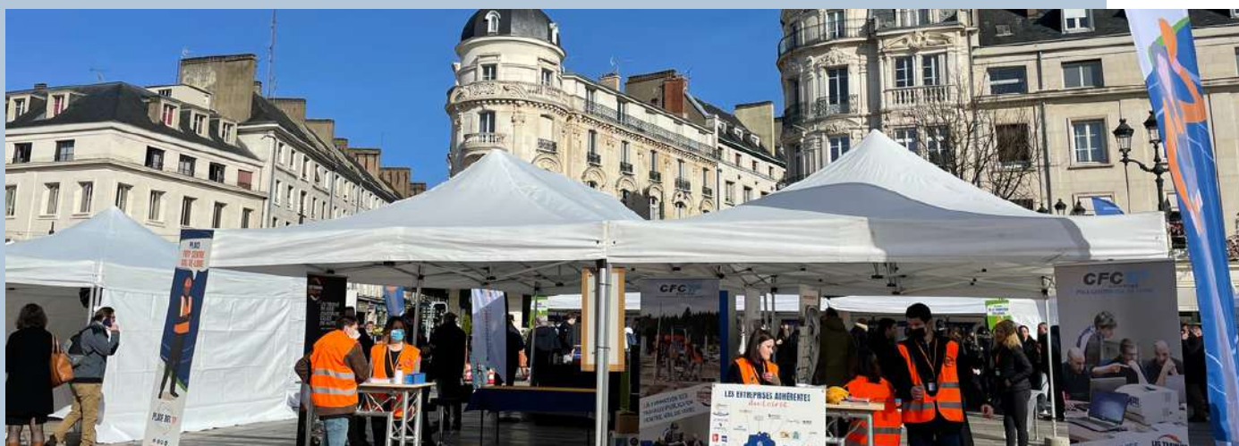
Retour en image de Place des TP, Place du Martroi, Orléans en 2022